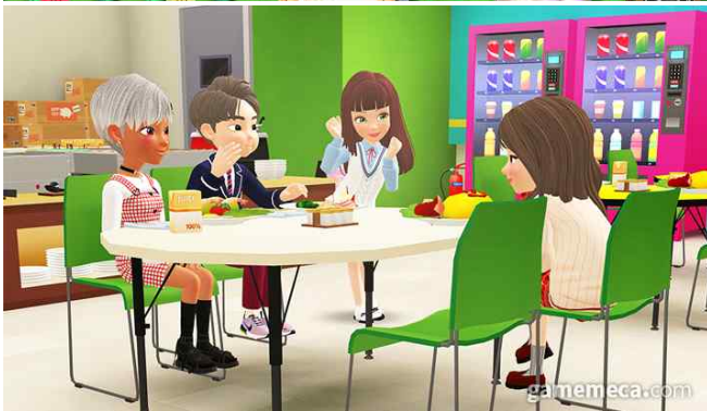
가상 현실에서 사교활동을 할 수 있는 게임인 동물의 숲과 제페토